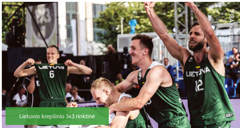
Lietuvos krepšinio 3x3 rinktinė