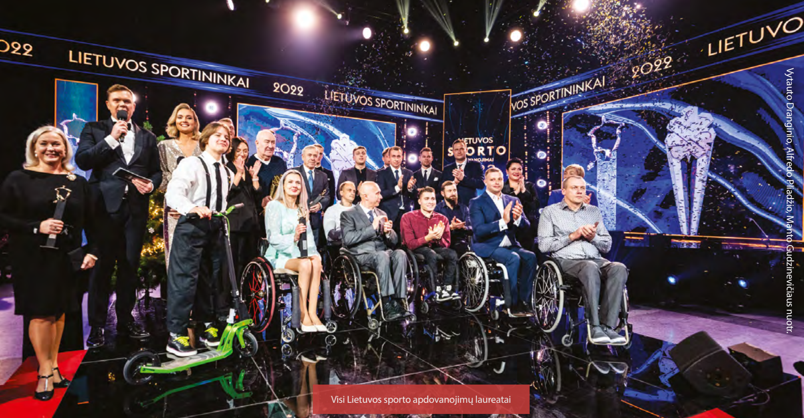
Visi Lietuvos sporto apdovanojimų laureatai