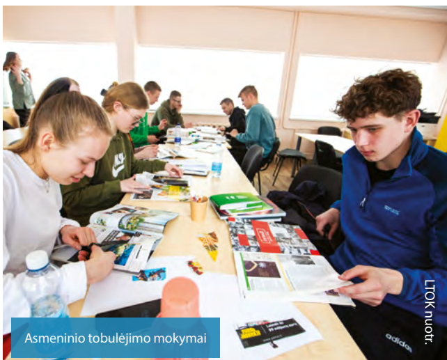
Asmeninio tobulėjimo mokymai

Šiame projekte apklausta per šimtą Lietuvos sportininkų ir šia apklausa siekta išsiaiškinti atletų supratimą apie antrąją karjerą, kokios pagalbos jiems stinga, kas, jų manymu, galėtų ir turėtų jiems padėti.