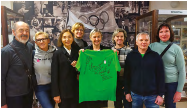
Olimpiečiai įteikė muziejaus direktorei LOA marškinėlius su savo parašais

Prieš penkerius metus Pasaulio olimpiečių asociacija (WOA) nusprendė leisti visų laikų olimpiečiams šalia savo pavardės rašyti santrumpą OLY, taip pagerbti olimpiečius ir išskirti juos iš kitų sportininkų.