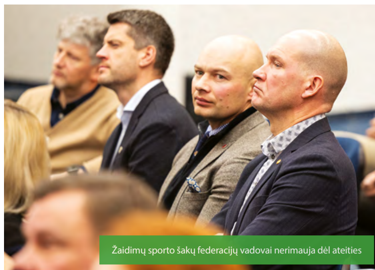
Žaidimų sporto šakų federacijų vadovai nerimą dėl ateities

Kritikos strėlės skriejo ir dėl Aukšto meistriško sportininkų rengimo sistemos tobulinimo darbo grupės, į kurios pastabas, federacijų atstovų tikinimu, buvo menkai atsižvelgta. Dauguma federacijų išklė atsiradusių treneriams ir teisėjams skiriamų maistpinigių mokėjimo klausimą, nes Aukšto meistriško sporto programų finansavimo sąlygų aprašas tai draudžia.