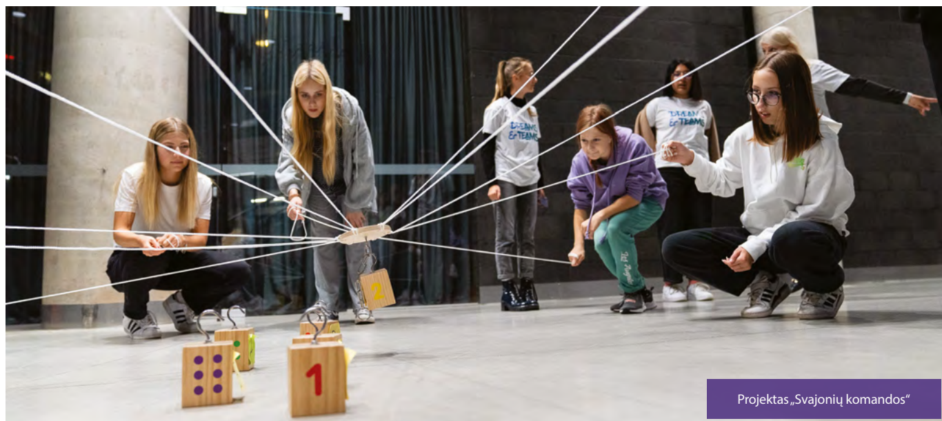
Projektas „Svajonių komandos“

Taip pat su komanda esame pakviesti įsitraukti į kitų šalių organizuojamus „Erasmus+“ projektus. Smagu, kad su mumis nori bendradarbiauti ir kiti nacionaliniai olimpiniai komitetai bei organizacijos.