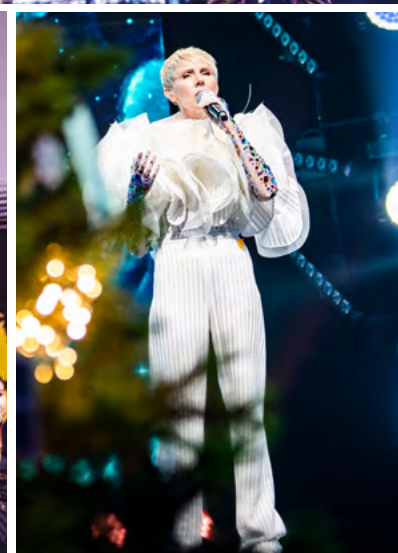
Šventėje koncertavo žinomi šalies atlikėjai