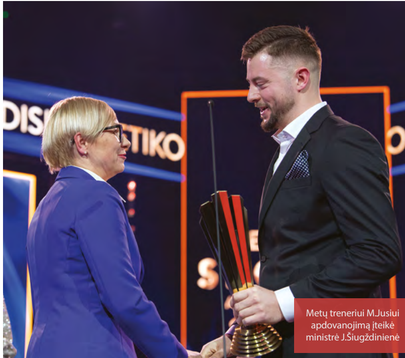
Metų treneriui M.Jusiui apdovanojimą įteikė ministrė J.Šiugzdinienė