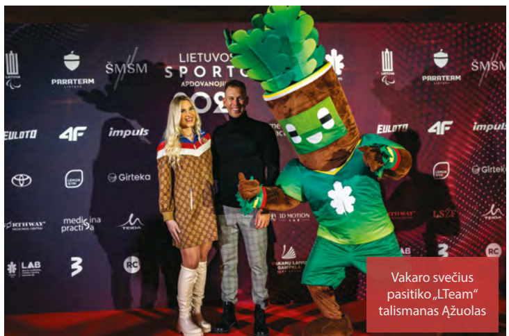
Vakaro svečius pasitiko „LTeam“ talismanas Ažuolas

Paralimpinio sporto laureatus išrinko Lietuvos paralimpinio komiteto Vykdomasis komitetas.