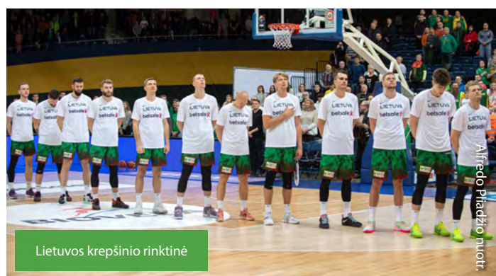
Lietuvos krepšinio rinktinė