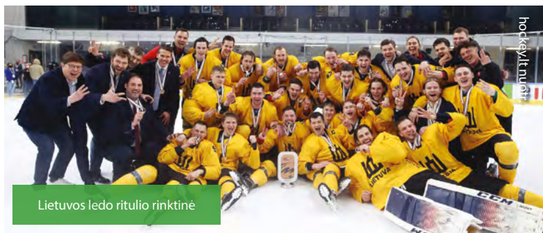
Lietuvos ledo ritulio rinktinė