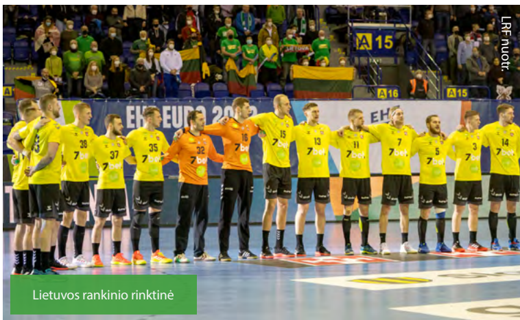
Lietuvos rankinio rinktinė

PERGALĖS, DEBIUTAI, SĖKMINGI SUGRĮŽIMAI, NETIKĖTOS NESĖKMĖS. 2022 METAIS LIETUVOS SPORTO PASAULYJE NETRŪKO ĮVYKIŲ, SULAUKUSIŲ SIRGALIŲ IR SPECIALISTŲ DĖMESIO. ŽURNALAS „OLIMPINĖ PANORAMA“ ATRINKO PO TRIS SVARBIAUSIUS KIEKVIENO 2022-ŪJŲ MĖNESIO SU LIETUVA SUSIJUSIUS SPORTO ĮVYKIUS.